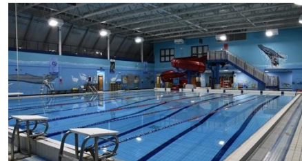
Piscine principale / Main Pool