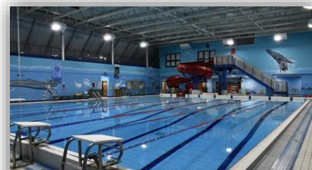
Piscine Principale / Main Pool